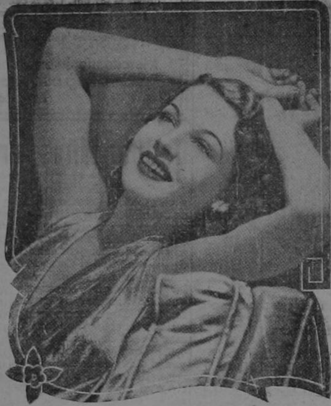
Ann Sheridan, estrella de la Warner Bros. declarada como prototipo de la mujer Norteamericana.