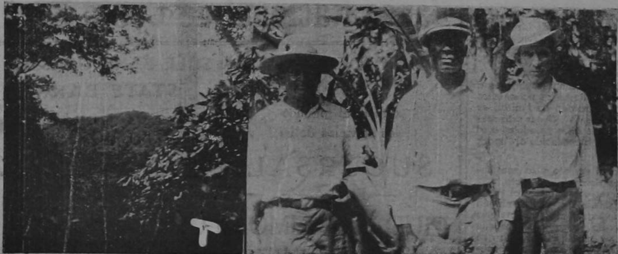
Vista del territorio que cambia ranas del Torkin, tierras abandonadas—por fincas cultivadas de cacao, hechos y habitados por costarricenses