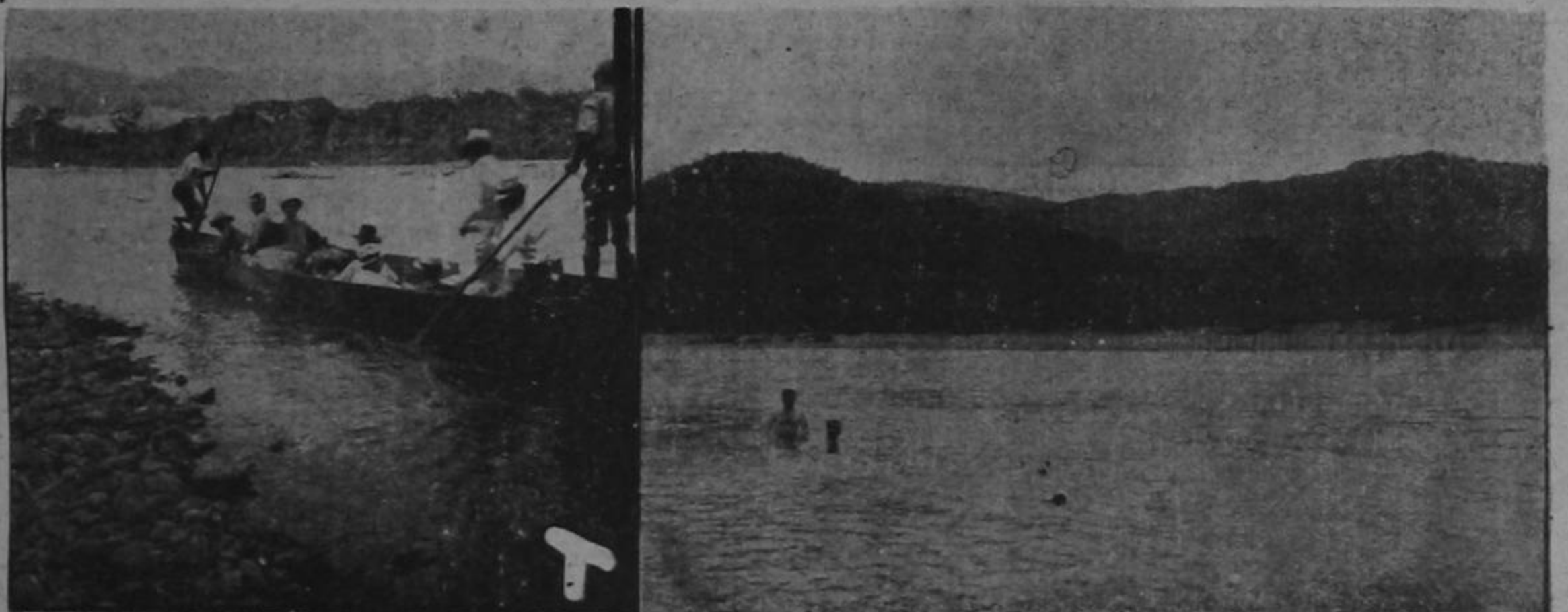
Demostración gráfica de la navegabilidad del caudaloso río Sixoala